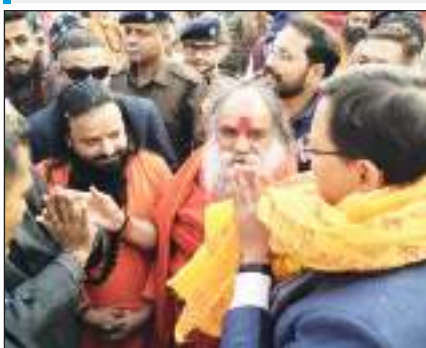
हरिद्वार से अयोध्या के लिए संतों ने शुरू की कलश यात्रा, सीएम धामी ने पूजा के बाद किया रवाना।