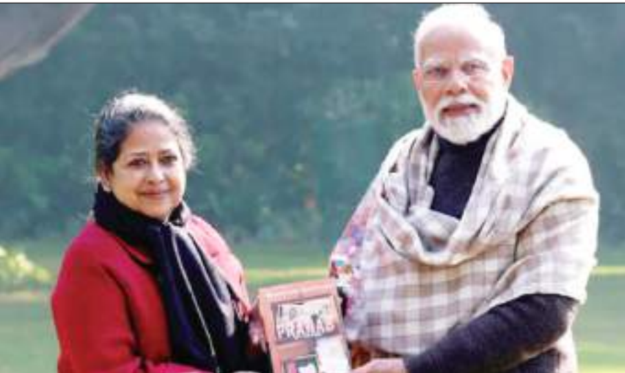
दिवंगत पूर्व राष्ट्रपति प्रणव मुखर्जी की बेटी शर्मिष्ठा ने प्रधानमंत्री नरेंद्र मोदी से मुलाकात की। उन्होंने प्रधानमंत्री को अपनी किताब 'इन प्रणव माय फादर : ए डॉटर रिमेंबर्स' की एक प्रति भेंट की।

11.28 प्रतिशत हो गई, इस अवधि के दौरान लगभग 24.82 करोड़ लोग इस श्रेणी से बाहर निकल गए। उत्तर प्रदेश में पिछले नौ वर्षों के दौरान बहुआयामी गरीबी से 5.94 करोड़ लोग बाहर निकले।