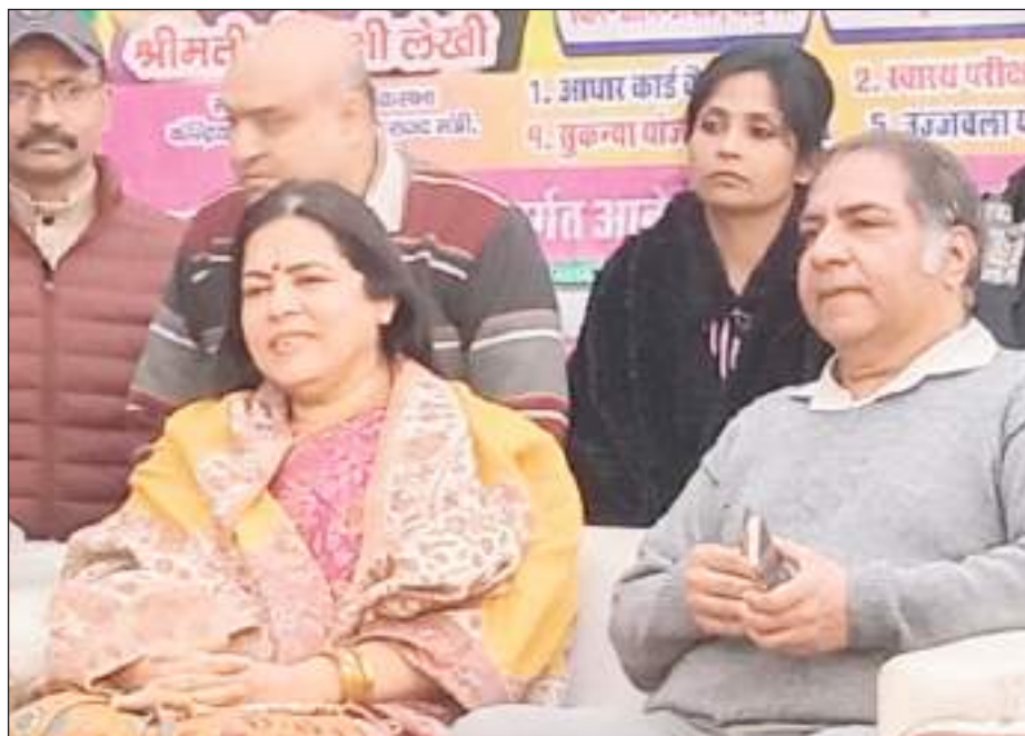
विकसित भारत संकल्प यात्रा कार्यक्रम में शामिल हुईं केंद्रीय मंत्री मीनाक्षी लेखी।